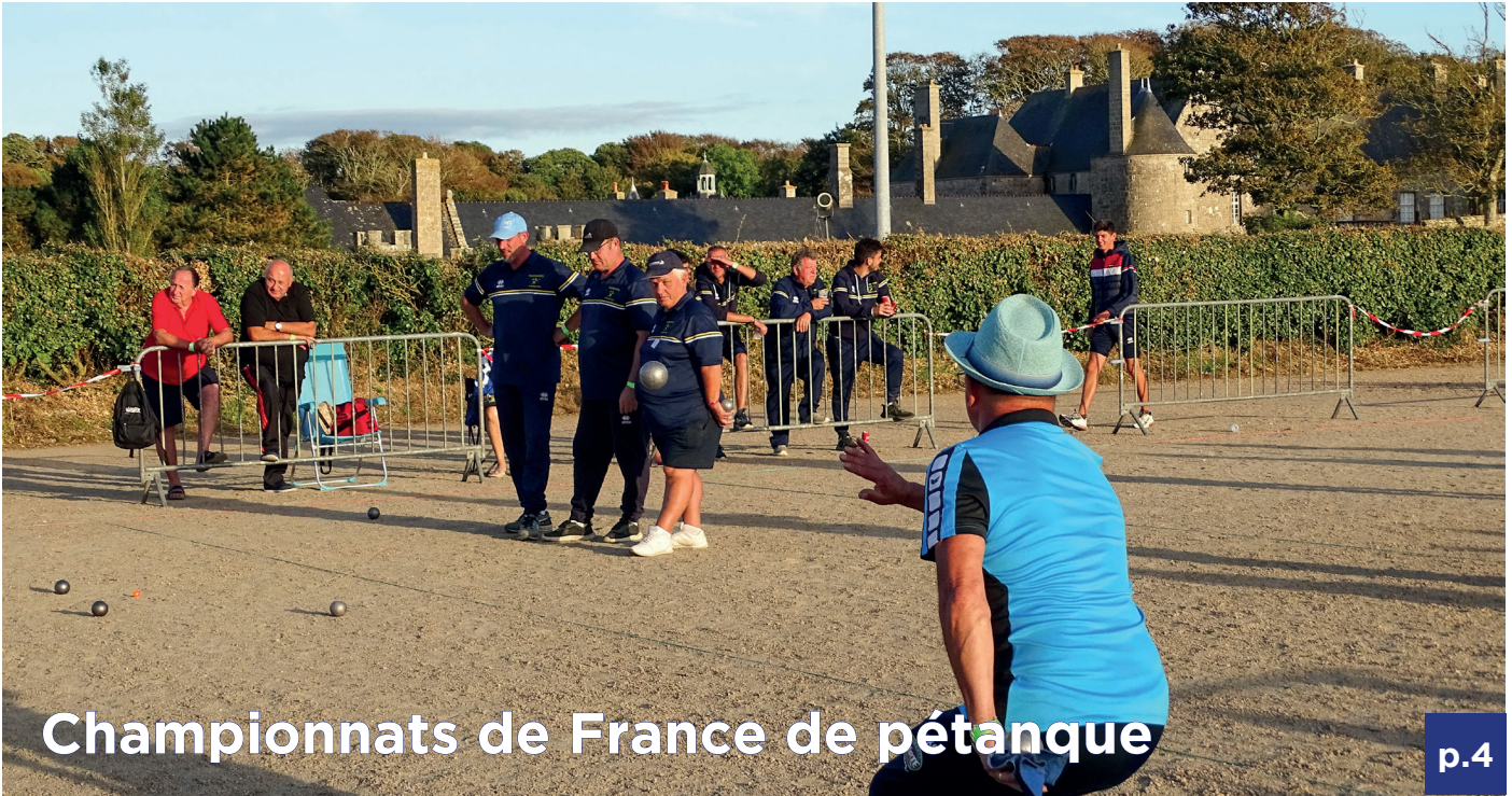
Championnats de France de pétanque