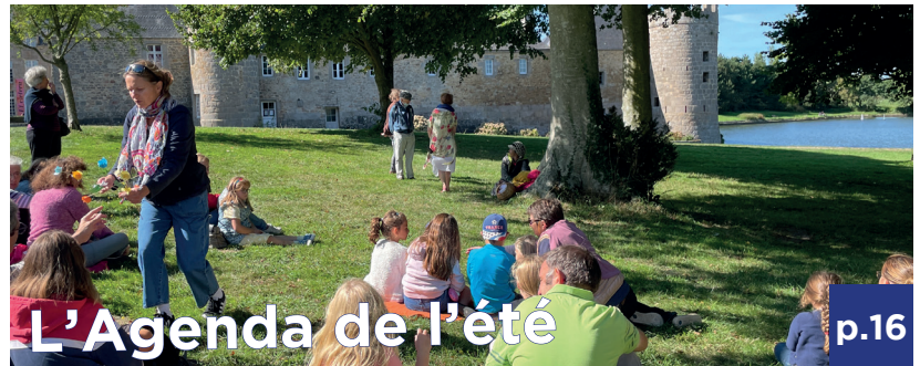
L'Agenda de l'été