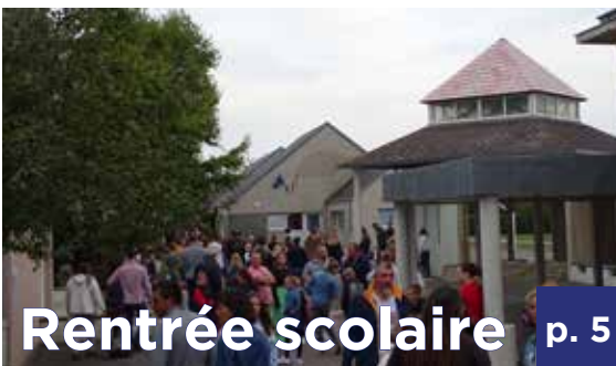
Rentrée scolaire p. 5