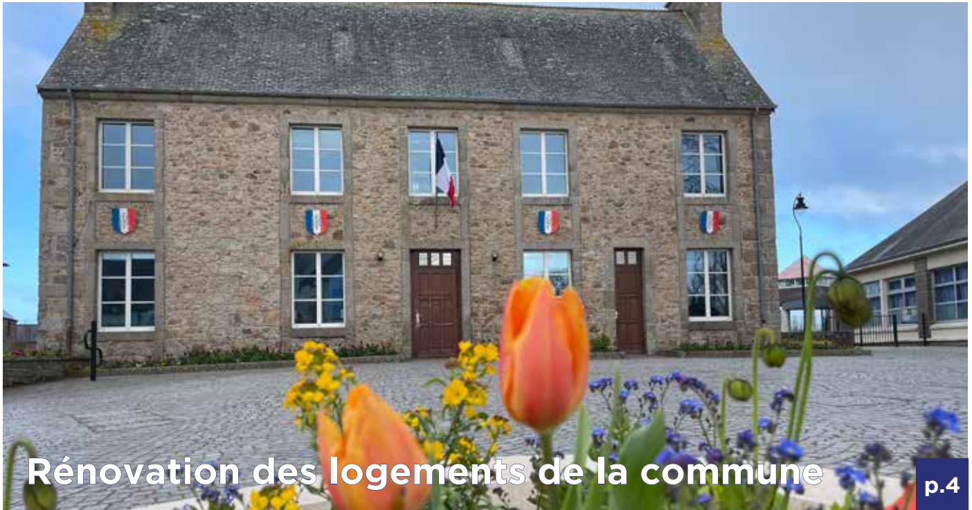
Rénovation des logements de la commune